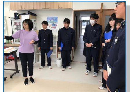
■ 新庄コアカレッジ